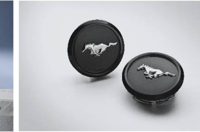
ชุดฝาครอบล้อ Mustang