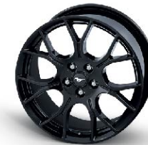
EcoBoost Performance pack wheel