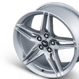
ล้ออัลลอยอะลูมิเนียมแบบ Forged ขนาด 19" x 9" (Pre-Order) ล้ออัลลอยอะลูมิเนียมแบบ Forged ขนาด 19" x 9.5" (Pre-Order)