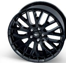
5.0L V8 GT Performance pack wheel