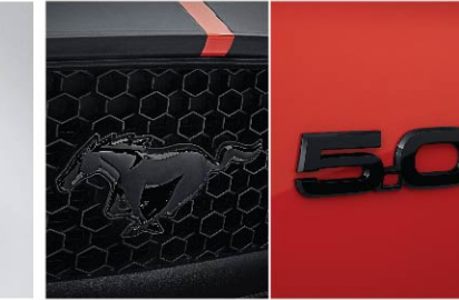
Mustang badge และ 5.0 badge สีดำ (Pre-Order)