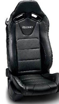
เบาะหนังสีดำ (RECARO® leather)