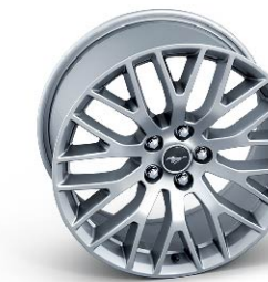
ล้ออัลลอยอะลูมิเนียมคู่หน้า ขนาด 19" x 9" (Pre-Order) ล้ออัลลอยอะลูมิเนียมคู่หลัง ขนาด 19" x 9.5" (Pre-Order)