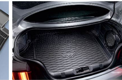
ถาดใส่ของท้ายรถ