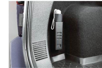
ที่เก็บรถ